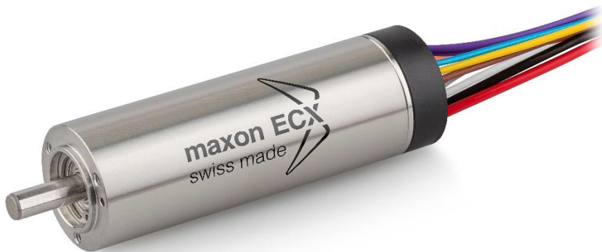
ECX SPEED 19 L: Der bürstenlose DC-Motor mit hohen Drehzahlen.