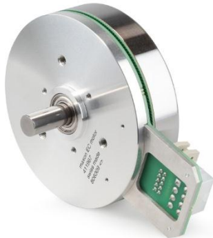
Abbildung 2: Bürstenloser Motor EC 90 flat mit MILE Encoder. Der 90 Watt Motor ist mit 2 Kanal MILE Encoder und acht verschiedenen Auflösungen zwischen 512 und 6400 Impulsen pro Umdrehung erhältlich. Bei Bedarf kann ein Planetengetriebe GP 52 mit 30 Nm Dauerdrehmoment angebaut werden.